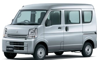
SILKY SILVER METALLIC (Z2S)