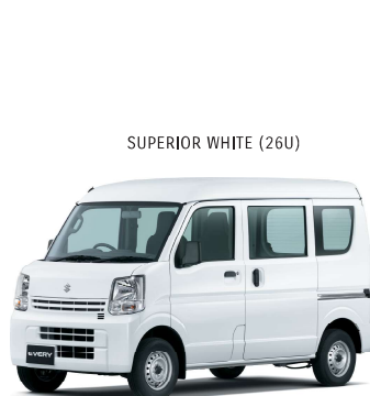
SUPERIOR WHITE (26U)